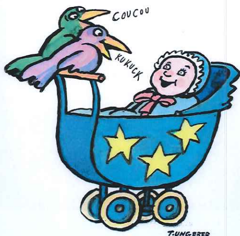
Illustration : Tomi Ungerer

Les objectifs des disciplines enseignées en allemand correspondent aux programmes de l'école primaire définis par le ministère de l'Éducation nationale. Le programme d'enseignement est le programme français dans son intégralité.